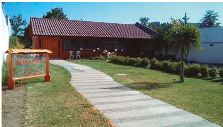
Igreja Cristã Maranata - Santiago - Chile

Gostaríamos de cumprimentar a todos com a Paz do Senhor Jesus! É uma grande alegria compartilharmos com nossos irmãos e irmãs as inúmeras experiências que o Senhor nos deu em todo este tempo, o que para o mundo tem sido difícil. Mas Sua igreja está sendo protegida pela Mão e Graça de Deus. Então queremos compartilhar as incontáveis experiências de curas, maravilhas, e como Senhor abriu portas de emprego para nossos irmãos. E assim como o Senhor que é a coisa mais importante agora, abençoou espiritualmente toda a Sua igreja. Gostaríamos de compartilhar com nossos irmãos e irmãs que nos ouvem nesta hora que a Escola Bíblica Dominical tem sido de grande experiência para nossa igreja. Conseguimos passar por um